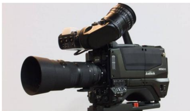
SHV 小型単板カメラ(重さ約 5kg)