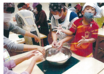
軽度の発達障害がある子どもたちへの「交流の場」の提供（福井）

※共同募金会を通じて、国内の福祉施設や支援を必要とする方々のために役立てられます。