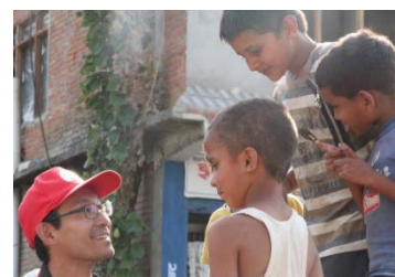
子どもたちとふれあい心のケア（ネパール）