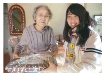
ひとり暮らしの高齢者への温かい心をこめたおせち料理のお届け（青森）