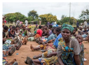
食料危機に伴う穀物配布に並ぶ人々（マラウイ）

※日本赤十字社を通じて、世界各地の紛争や自然災害などに苦しむ人々のために役立てられます。