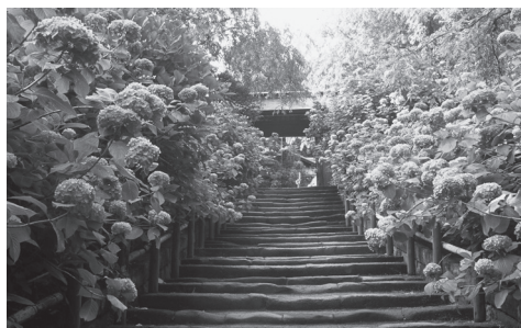
معبد بودایی میگتسوئین (Meigetsuin)