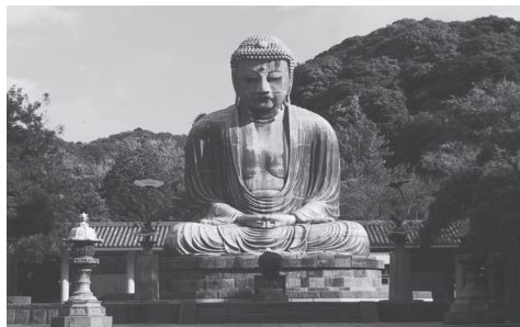
بودای بزرگ کاماکورا

کاماکورا حدود یک ساعت با قطار از توکیو فاصله دارد. اولین حکومت شوگونی (سپهسالاری) در ژاپن حدود ۸۰۰ سال پیش در کاماکورا شکل گرفت. معبد شینتوی تسوروگانوکا هاچیمانگو (Tsurugaoka Hachimangu) و مجسمه بودای بزرگ ۱۱ متری از جمله مکان‌های دیدنی این شهر هستند.