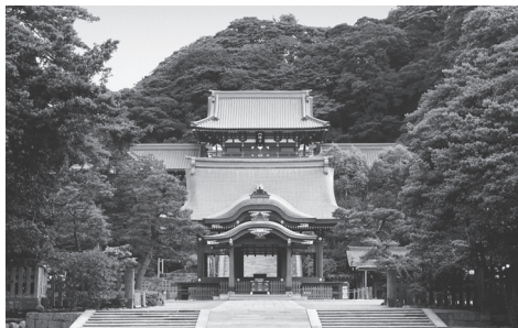
معبد شینتوی تسوروگانوکا هاچیمانگو