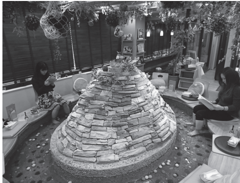
کافه آشی یو

در ژاپن کافه های جالب دیگری نیز وجود دارند مانند maid café (کافه ای که پیشخدمت هایش لباس خدمتکاران قرن ۱۹ فرانسه را به تن دارند)، کافه آسمان نما، و کافه آشی یو (به معنی حمام پا) که در آنها می توانید پای خود را در آب گرم قرار دهید.